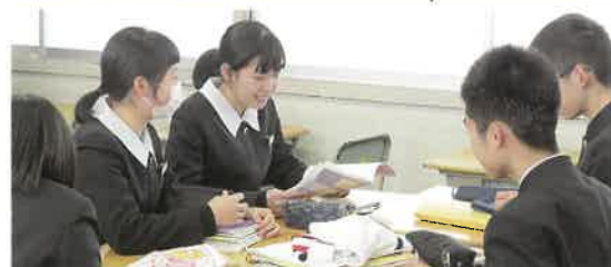
少人数・習熟度別指導でのグループ学習の様子

「国語」「数学」「英語」では、高校の学習内容の一部を中学校で学びます。「理科」「社会」では、発展的内容としてより深い事象の学習も行っています。3年生では、2学期からハイレベル講座を開き、より発展的な内容の学習を行います。