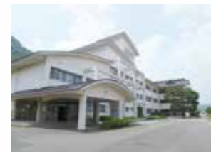
武雄高等学校校舎