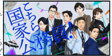
内閣人事局プロジェクトより

今回は、国家公務員について解説します。国家公務員は、大まかに分けると「総合職(キャリア組・官僚コース)」・「一般職(ノンキャリア)」・「専門職」の3つに分かれます。また、人事院が採用試験を実施する行政府の職員、裁判所が採用試験を実施する司法府の職員、衆議院や参議院といった国会に勤務する立法府の職員というように、雇われる機関による違いもあります。国家公務員を目指す人は、法学部・経済学部出身が多いようですが、どの学部からも受験は可能です。将来、国家公務員を目指してみませんか。職種によって試験のハードルは違います。特に国家公務員総合職は、早めの準備が必要です。