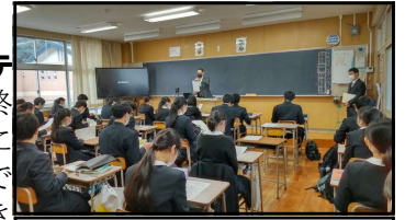
テスト前日の直前集会

1月14日(土)・15日(日)の日程で、3年目となった新制度入試「大学入学共通テスト」が実施され、追試に回るようになった3名を除く200名が無事に2日間の受験を終えることができました。1・2年生にも「受験生のために」を合言葉に感染拡大防止策にご協力をお願いしてきましたが、皆様のご協力で何とか共通テスト本番を迎えることができました。ご協力に感謝します。ただ、県内でもまだまだ感染が拡大していますので、引き続き感染防止にご協力をよろしくお願いいたします。