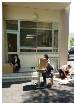
フェースシールド