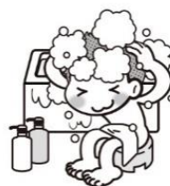
毎日お風呂に入る