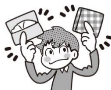
ポケットにハンカチとティッシュ