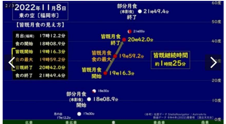
【参考】明日の福岡市の星空の予想

明日、月が、夕方6時10分位から少しずつ色が変わり、夜の7時16分位から夜の8時42分位まで、全体が赤っぽい月になり、夜の9時50分頃には元に戻る（皆既食）そうです。