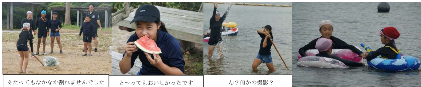
あたってもなかなか割れませんでした