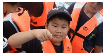
お正月には15cm位まで成長する稚エビ

お陰様で、子ども達は、豊かな時間を過ごすことができ、子ども達の満面の笑顔をたくさん見る(お見せする)ことができました。