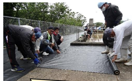
プールサイドに防草シートを地区の皆さんに張っていただきました。