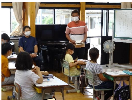
区長さんから強風対策をしなければならぬとアドバイスをいただきました。