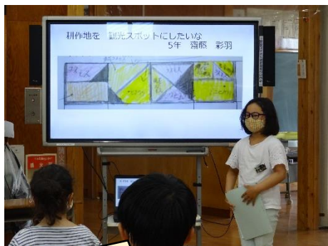
子供たち一人一人が、自分で考えた花畑のデザインを発表しました。

高島小学校の総合的な学習の時間に、「高島をもっとよくするためにできること」をテーマとした学習が進められています。調査活動や話し合い活動を繰り返しながら、高島をよりよくするために何が自分たちにできるのかを探る中で、“荒地活用プロジェクト”が立ち上がりました。このプロジェクトは、学校の西側の空き地を花畑にして（縦 10m／横 40m）、地域の方や観光で訪れた方に楽しんでもらおうというもので、子供たち一人一人が花畑のデザインを考えて発表しました。これから、道づくり、種まき、支柱たて・・・と続いていきます。その過程でいろいろな問題も発生するでしょうが、何とかこのプロジェクトを実現させてほしいと思っています。