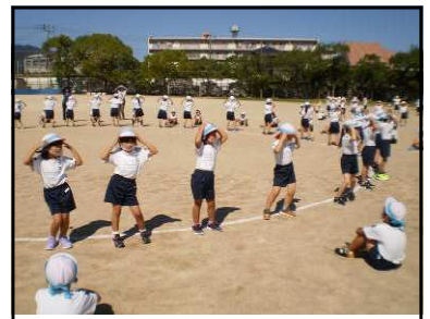
1・2年ダンシング玉入れ