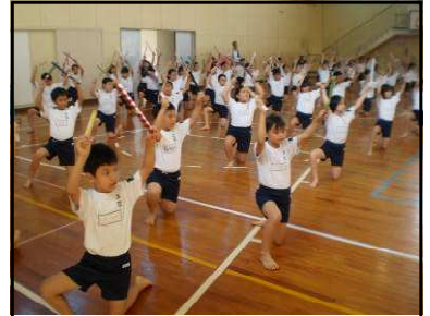
5・6年伊万里太鼓踊り

お願い事が多いのは申し訳なく思いますが、みなさんが安全で、そして楽しめる体育大会になるためのものですから、ご理解の上、ご協力いただきますようお願いいたします。