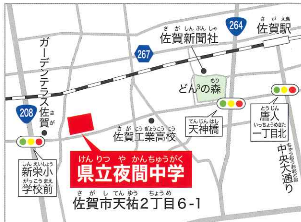
佐賀駅から徒歩約25分