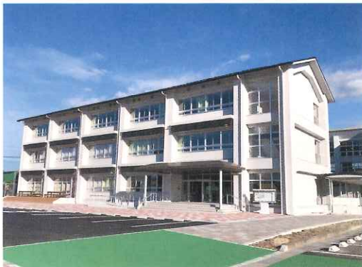
佐賀北高校通信制校舎内に設置