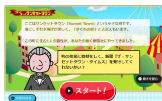
▲家庭での学習履歴が残ります