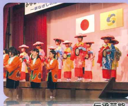
伝承芸能（浮立）の伝承