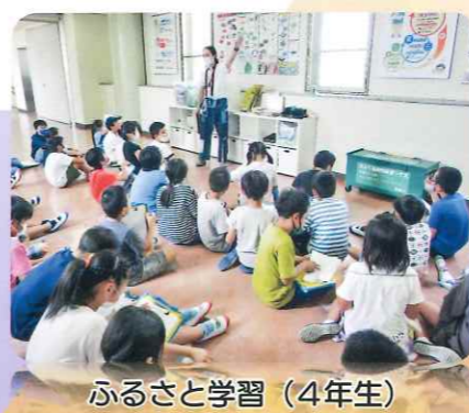
ふるさと学習（4年生）