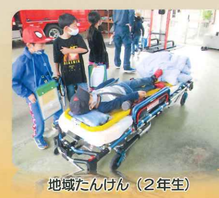
地域たんけん（2年生）