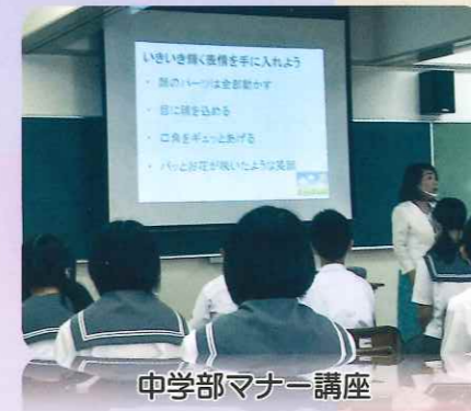
中学部マナー講座