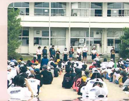
小中合同ボランティア活動