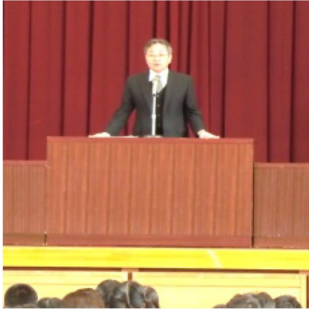
↑2・3年生を前に熱心に話される蒲原校長先生

最初に、先月の修了式で話したことは何かを生徒に投げかけた後、「自分の夢実現には執念が必要です。目標を立てて、執念を持ってその目標に向かって頑張るとともに、新入生に尊敬される先輩になっ