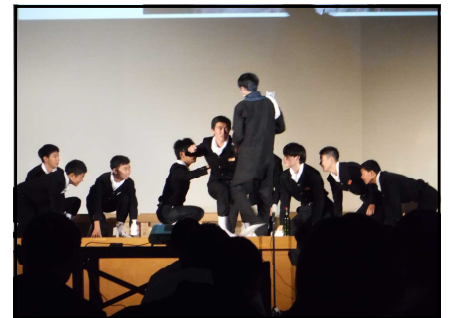
3年生のステージ発表 「僕たちの明日へ・・・」