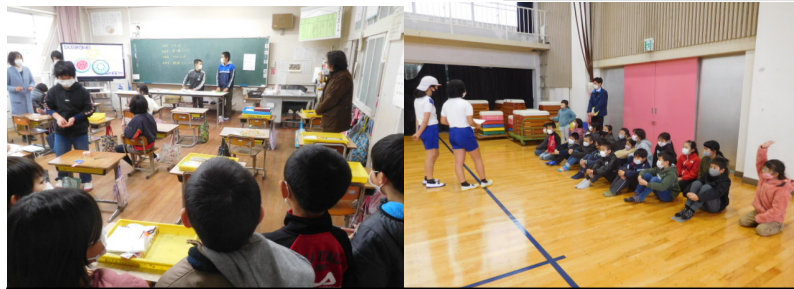
活動場所で見学したり質問したりする3年生

毎年、この時期になると、3年生は進級してからどのクラブに入ろうかと迷います。そこで、クラブ活動を見学することで、入りたいクラブをイメージ化し、決めることができます。令和2年度は、「スポーツ」「自然・科学」「インドア」「パソコン」「家庭科」の5つで行っていました。3年生には、どのクラブが魅力的に映ったでしょうか。