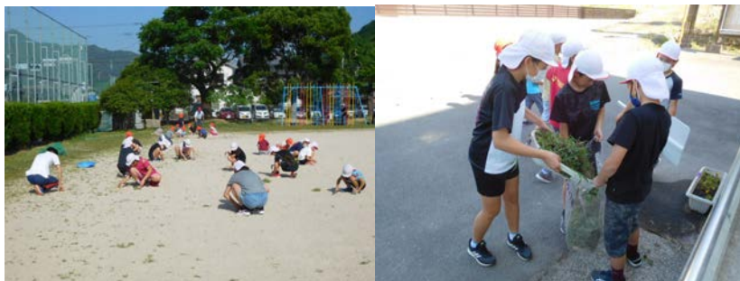
暑くても一生懸命の草むしり（左）片付けは高学年で（右）

6月9日（火）の朝の時間は、クリーンタイムでした。運動会やはつらつタイムの班と同じように、たて割りグループでの活動です。朝からとても暑かったのですが、時間いっぱい一生懸命草取りを頑張りました。取った草は、高学年が捨てに行ったり袋詰めしたりと活躍してくれました。道具の片付けもきれいにでき、「さすが塩田っ子！」と感じました。