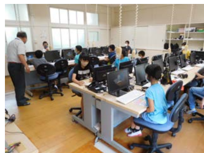
操作を楽しむパソコンクラブ

6月8日(月)の6時間目に、4年生以上のクラブ活動がありました。今年度のクラブは、「スポーツ」「自然・科学」「インドア」「パソコン」「家庭科」の5つに分かれています。子どもたちは、自分の興味があるクラブに参加します。職員が2, 3名ずつ、クラブのお世話をし、活動が始まります。今回は、めあてを決めたり次回の活動内容を決めたりしました。ミサンガづくりをしたクラブもありました。2か月に1回程度のクラブですが、子どもたちは、とても楽しみにしています。