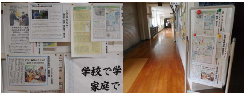
校長室や来賓玄関廊下に掲示中！

佐賀新聞、西日本新聞、読売新聞など、子どもたちの活躍している記事がたくさん掲載されています。また、NHKやケーブルテレビでも活動の様子が放映されています。先日は、6年生の手すき和紙体験が放映されたようです。頑張っている子どもたちの様子が、このお便りだけでなく、新聞やテレビでも伝えられることが嬉しいです。