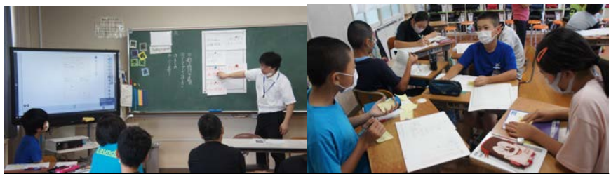
割り付けのポイントを確認し、グループで話し合う6年生

7月2日(木)は、6年生の国語の研究授業でした。6年生の教材には、「ポスターを作ろう」があります。6年生は、この時期にふさわしい「防災ポスターを作ろう」というテーマで授業を進められました。さすが6年生です。落ち着いた学習態度でした。