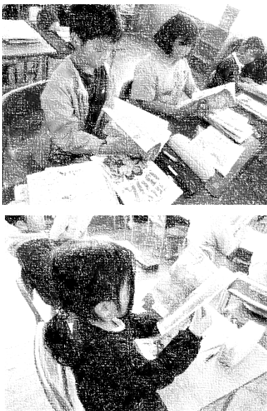
新しい教科書を受け取り、教科書の中身を確認する様子

本校では全校統一で「 さしっ子ノート 」を活用しています。こちらも、お子さんの成長・相談等、担任と思いを共有する手段としてご活用ください。一年間、よろしく願いいたします。