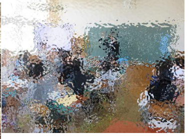
「先生の名前は? 3択です?」「先生の趣味は何でしょう?」