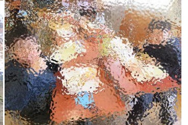
「給食、うまーっ ♥」「みんなでたべるとおいしい〜♥」