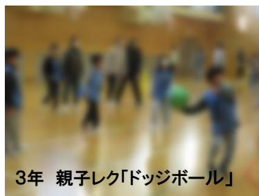
3年 親子レク「ドッジボール」