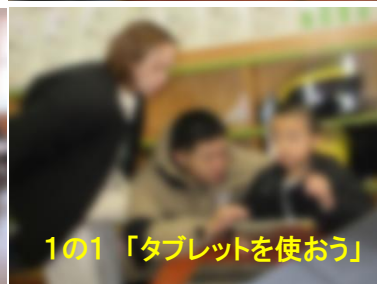
1の1「タブレットを使おう」

授業参観、学年親子レク、6年生懇談会と、ご多忙中にご出席いただきありがとうございました。授業やレクの中で親子のほほえましい関わりも見ることができました。今の学年で過ごす日も40日を切りました。6年生はあと36日です。子どもたちが新しい学年に向かって、気持ちの面でも成長を遂げる時期となります。自信と意欲をもって進級できるよう、プラスの言葉でたくさん励ましていきたいと思います。今後ともよろしくお願いいたします。