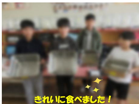
きれいに食べました！

「フードロスをなくそう」と意識をして取り組んでいるのが5年生です。二学期に社会科で「食料生産」のことを学習したことがきっかけで、給食の残菜に意識が向くようになったそうです。さらに、担任の絵本の読み聞かせにより、子どもの気持ちがさらに高まりました。この日も食缶を、きれいに空っぽにして返却しました。自分が食べられる分をしっかりと食べ、残った物は余力のある人が食べ、協力体制で食べています。何より5年生のみんなが感謝の気持ちで、笑顔で食べているところがとても素敵です。