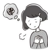
悩んでいる ことがあるとき