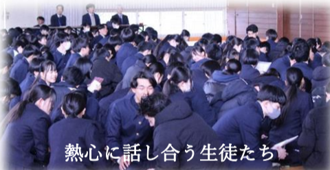
熱心に話し合う生徒たち