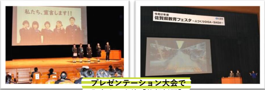
プレゼンテーション大会で発表する生徒