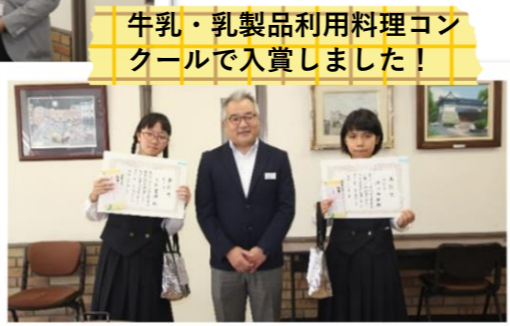
牛乳・乳製品利用料理コンクールで入賞しました!