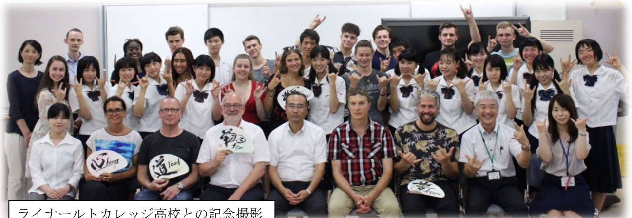
ライナールトカレッジ高校との記念撮影