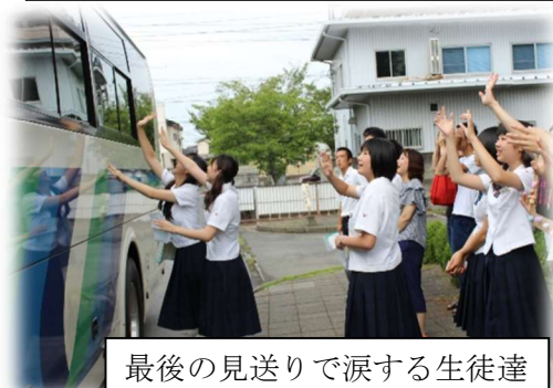
最後の見送りで涙する生徒達