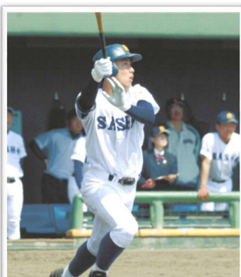
(4/7 佐賀新聞掲載写真)