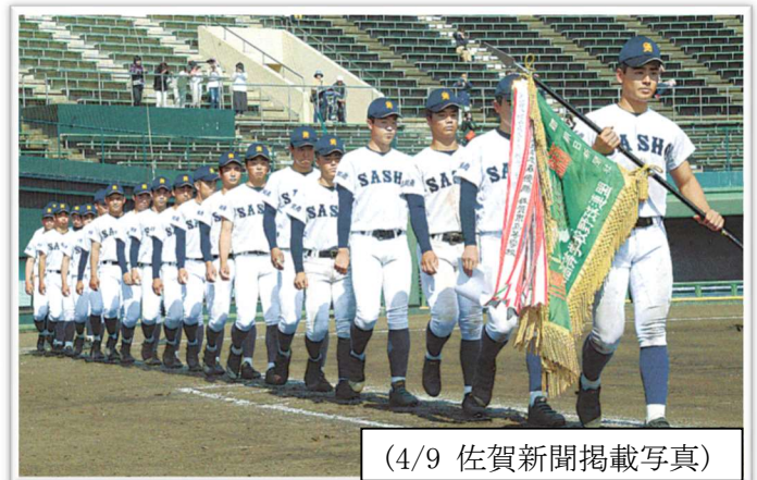
(4/9 佐賀新聞掲載写真)

本校野球部は4月20日(土)から鹿児島県で開かれた九州大会に出場しました。2回戦で福岡県の筑陽学園に惜しくも敗れました。