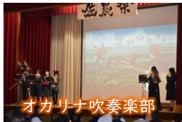
オカリナ吹奏楽部

【展示】各学科からは,日頃の授業で学んでいる内容や,佐農祭に向けて栽培・製造・作製したものが展示されました。書道部や美術部からは,日頃の活動で制作した作品が展示されました。職員展示では,各先生の趣味や特技に関するものが展示され,バラエティに富んだ内容でした。また,今年度も全校生徒でモザイクアートの製作に取り組み,校舎壁面に展示されました。どの展示物にも出展者の思いが込められており,多くの生徒が大変興味深く見学していました。