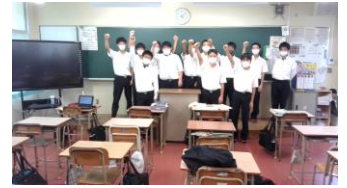
就職試験頑張ろう!の様子