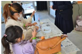
👉 ハーバリウム体験(環境工学科)