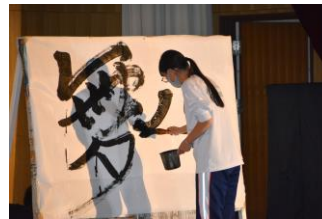
👍 書道部(パフォーマンス)