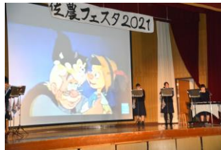
👍 オカリナ吹奏楽部(演奏)