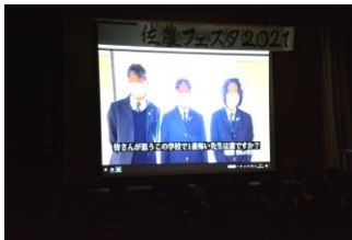
👍 生徒会(オープニング)

これらの活動を通して、生徒の創造性・自主性・協調性を育むことができました。なにより、多くの生徒が楽しんでいる様子が大変印象的でした。