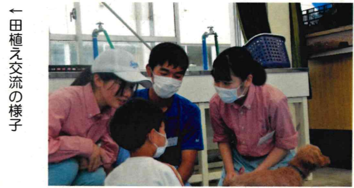
← 田植え交流の様子