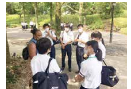
英会話体験プログラム