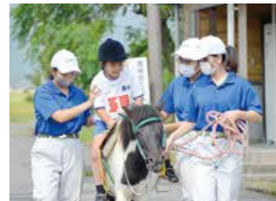
動物ふれあい活動