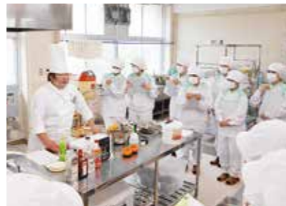
外部講師による指導