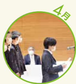
入学式 1年生セルフアップ研修 歌垣山ハイキング