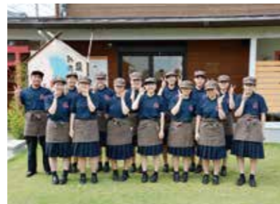
カフェ・マルシェ

地域の清掃活動や被災地での復興ボランティア活動に参加し、地域社会に積極的に貢献しようとする人材を育成します。