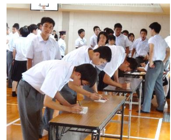
誰に投票しようかな・・・

演説会は推薦者による応援演説と候補者本人の演説からなり、入念に準備されたスピーチに、生徒諸君は熱心に耳を傾けていました。