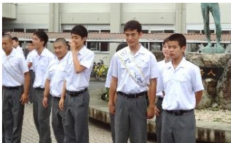
候補者と応援者による朝の選挙運動