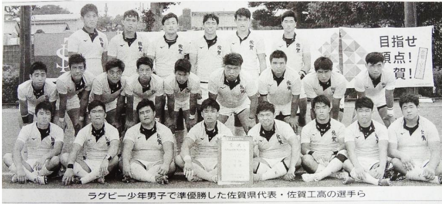
ラグビー少年男子で準優勝した佐賀県代表・佐賀工高の選手ら