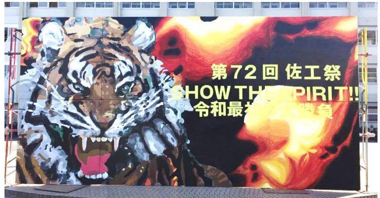
美術部制作の大パネル

今年の佐工祭は「Show the Spirit～令和最初の大勝負～」をテーマに、文化祭・体育祭とも大いに盛り上がりました。超大型台風19号が日本に接近する中で準備が進められ、昨年同様、今年も延期か？と心配されましたが、予定通りの実施となりました。