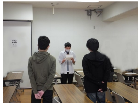
【新入生代表のあいさつ】