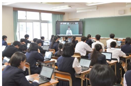
オンライン生徒総会