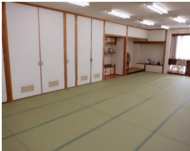
和紙でできているという大会議室の畳は いつまでも美しい緑色！

2階のいちばん奥にある大会議室の42帖の畳は、4年前、第5回卒業のある先輩からの寄付で新しい畳にさせていただきましたが、この畳表はイグサではなく和紙で作られています。変色しにくく、丈夫な高級品です。また、正門脇と中庭等にある、しだれ桜も同じ先輩からの寄贈です。大切にかわいがってください。