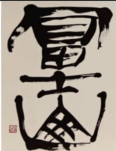
左: 宮地嶽第58回光の道全国競書大会 文部科学大臣賞