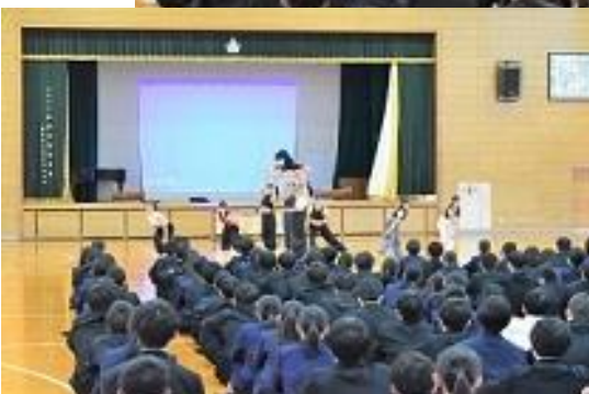
(左上から時計回りに) 剣道、空手道、弓道、ESS、新体操の各部活動