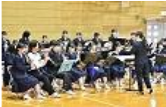
吹奏楽部による演奏

4月9日（火）、令和6年度入学式が挙行され、全276名が佐賀北高校の生徒となりました。ご入学おめでとうございます。みなさんのご入学を佐賀北高校の一同、心待ちにしておりました。これからともにさまざまなことを学びながら成長していきましょう。どうぞよろしくお祈りします。