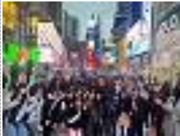
タイムズスクエアにて

旅程の2日目と最終日はニューヨークの中心部・マンハッタンなどを観光し、タイムズスクエアやワシントンブリッジ、自由の女神などを見ました。旅程の3日目から10日目ではグレンズフォールズ高校の授業を見学させてもらったり、ホストファミリーと過ごしたりしました。特に日本とは違う学校のシステムや家族の過ごし方、文化の差を感じて発見や学びが多くあったようです。ほとんどの生徒が最終日には「帰りたくない」と言っていました。