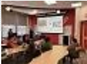
プレゼンをしている本校生徒