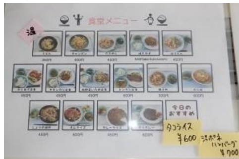
北館食堂のメニュー表。この日のおすすめメニューはオムライスとジャポネハンバーグ。