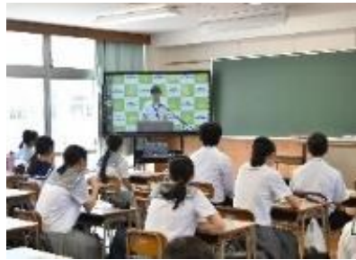
教室で学校紹介を見ている中学生