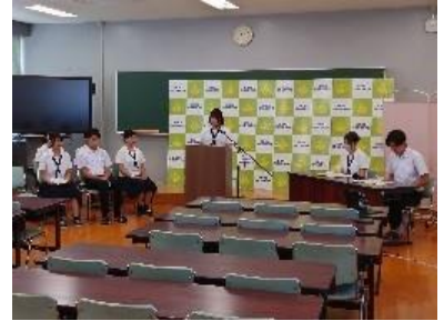
会議室から学校紹介を配信しています