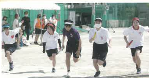
クラス対抗リレー

まだ夏の暑さが残る晴天の下、第60回体育祭が開催されました。新型コロナウイルスの感染拡大と共に入学した3年生にとっては、いろいろな思いを乗り越え、忘れられない思い出になったでしょう。どの競技も盛り上がり、子供たちの笑顔はキラキラととても輝いていて、素晴らしい体育祭でした。