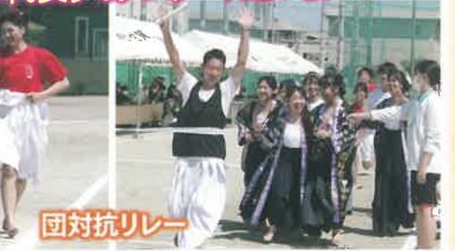
北高を代表するアスリート達の戦い!