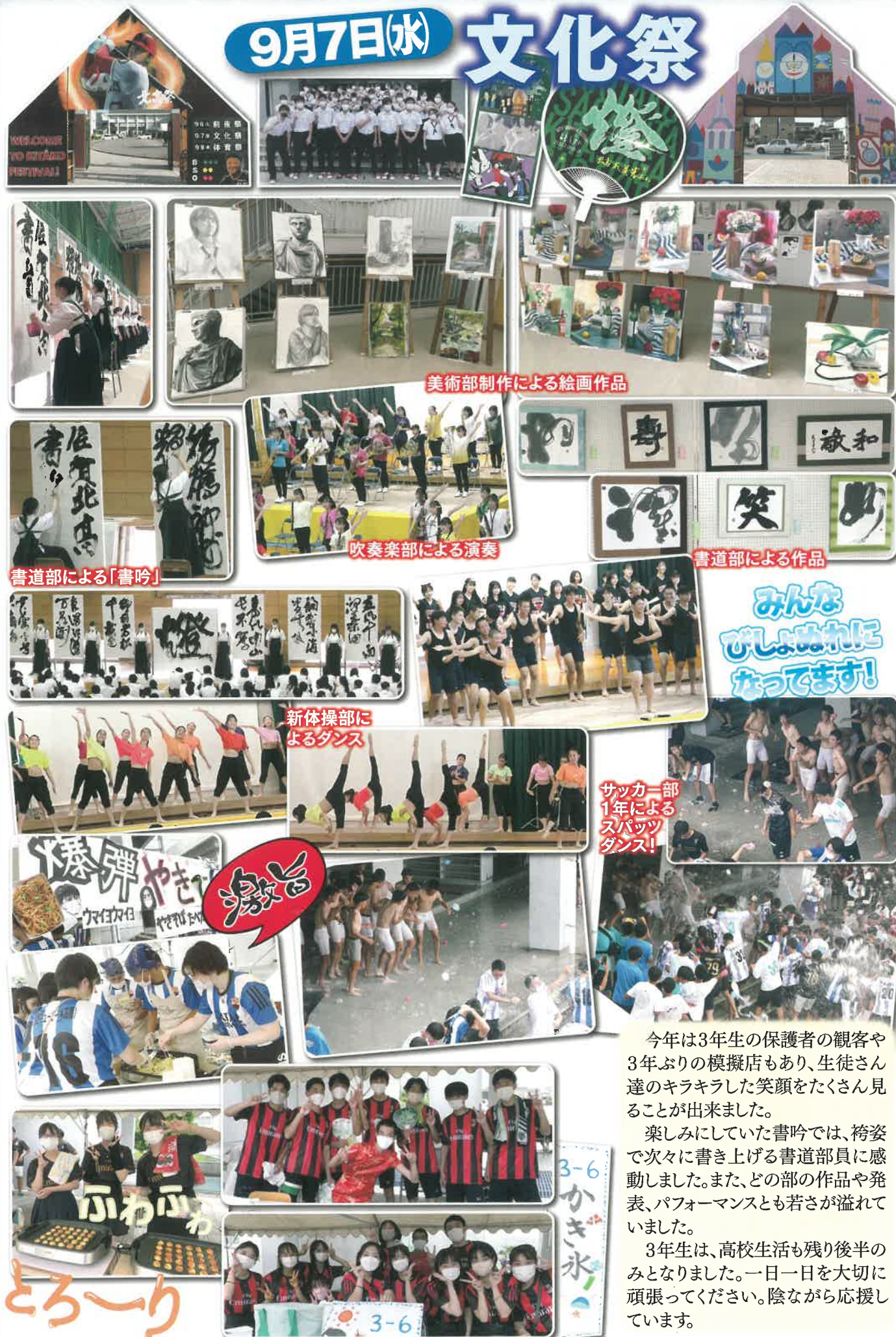
美術部制作による絵画作品