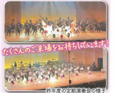
たくさんのご来場をお待ちしています!

定期演奏会では、迫力のあるクラシック、笑いあり涙ありのミュージカル、かっこいい振りとかわい子によるポップステージなど、北高ならではの趣向を凝らしたパフォーマンスで皆さんを全力で楽しませます。さらにパワーアップした私たちの姿をぜひ見に来てください!!