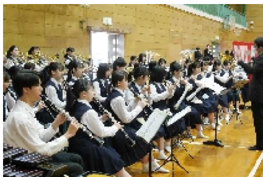
吹奏楽部による演奏

新入生は少し緊張の面持ちでしたが、入学式を終えた後のホームルームで黒板アートの出迎えを受けたり、翌日からのオリエンテーションや先輩たちによる歓迎のパフォーマンスに触れたりして、新しい学校生活への期待が高まったようです。