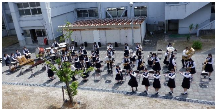
4/10(月)、11(火)、13(木) 吹奏楽部ガーデンコンサート

26日(金) 高校総体(～30日(火)) NHK杯高校野球大会(31日(水)) *不参加の生徒は自宅学習