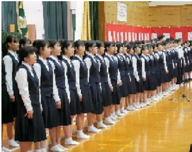
音楽部による校歌紹介