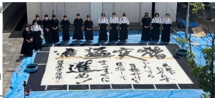
4/12(水)書道部パフォーマンス

※考查前および高校総体前につき、5月は8日(月)以降の朝補習はありません。6月5日(月)より再開します(1年・2年文系は6日(火))。