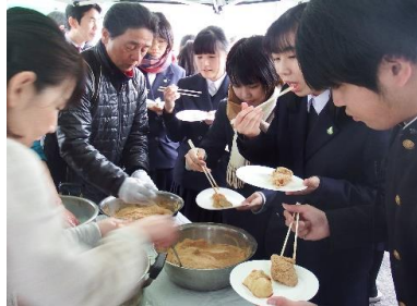
つきたての餅を求めて 長蛇の列！