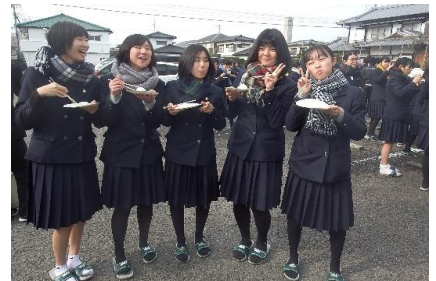
「おいーい！」 満面の笑み！

年が明けて1月8日(水)には、後援会主催の鏡開き神事が執り行われました。神主さんをお招きし、3年生の大学入試合格を祈願していただきました。鏡割り、玉串奉奠は生徒代表が行いました。神事の後には、温かいぜんざいが振る舞われ、おいしいぜんざいに生徒たちの笑顔がこぼれました。