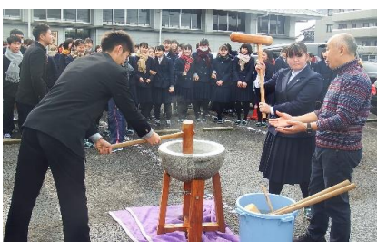
蒸したてのもち米を カー杯つきます！