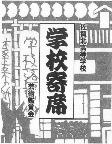
紙切り作：三代目 林家正業