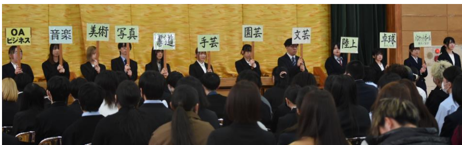
部活動紹介の様子

入学式に先立ち、退任式・新任式・始業式が行われました。退任される先生方からは、本校での教育活動を通して得られた経験や思いが丁寧に語られ、今後へとつながる暖かく力強いあいさつが会場に深く響きました。生徒会より感謝の花束贈呈が行われ、これまでのご尽力に対する感謝の気持ちが伝えられました。続いて、新たに着任された先生方が紹介され、生徒たちは新年度の始まりを実感していました。入学式後には、生徒会主催による部活動紹介が行われました。新入生のみなさんには、部活動や生徒会行事に積極的に参加し、多くの仲間とつながりを深めてほしいと思います。