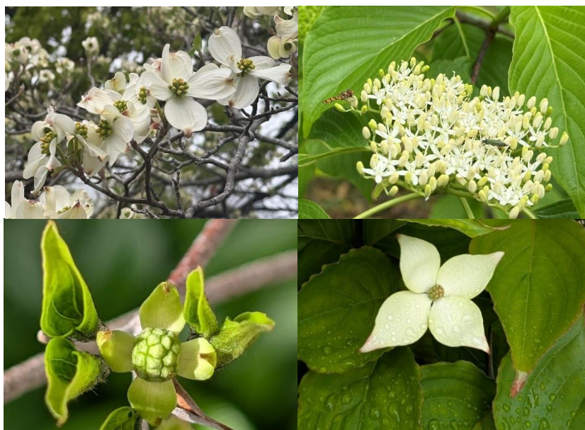
写真はハナミズキ(左上)、ミズキ(右上)、ヤマボウシ(左下、右下)

春に咲くハナミズキ、初夏に白い花を広げるミズキ、そして6月頃に上向きに咲くヤマボウシへと、同じ仲間の木々が季節をつないでいく。同じミズキ科ミズキ属に属しながらも、それぞれに異なる表情を見せつつ、少しずつ時期を重ねていくその姿は、多様な学びや歩みが共にある本校の姿とも重なる。ヤマボウシが空を仰ぐ頃、本校でも新たな学校生活が本格的に動き出す。その花言葉である「友情」のように、人とのつながりを大切にしながら、一人ひとりが自分の歩みを着実に進めていきたい。