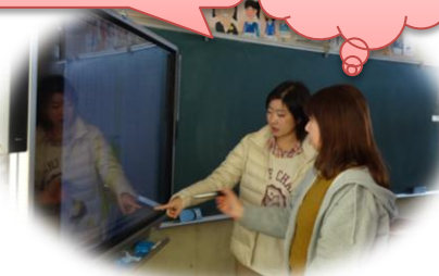
操作の仕方を教わり、操作挑戦中!!