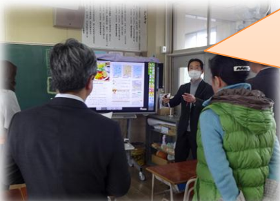
社会のデジタル教科書を使った実演