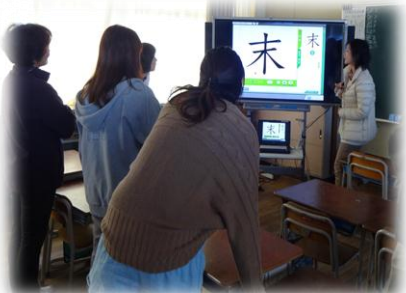
筆順の指導の実演

教材文の範読、筆順指導などに、デジタル教科書を効果的に使っている実践の紹介がありました。