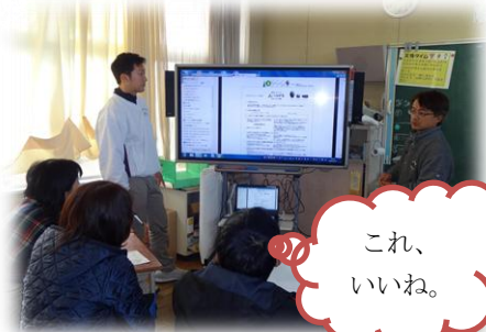
「NHK for school」の実演