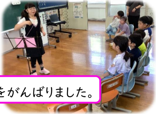
司会をがんばりました。