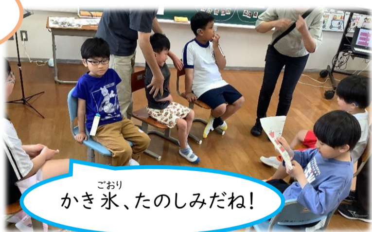
かき氷、たのしみだね!