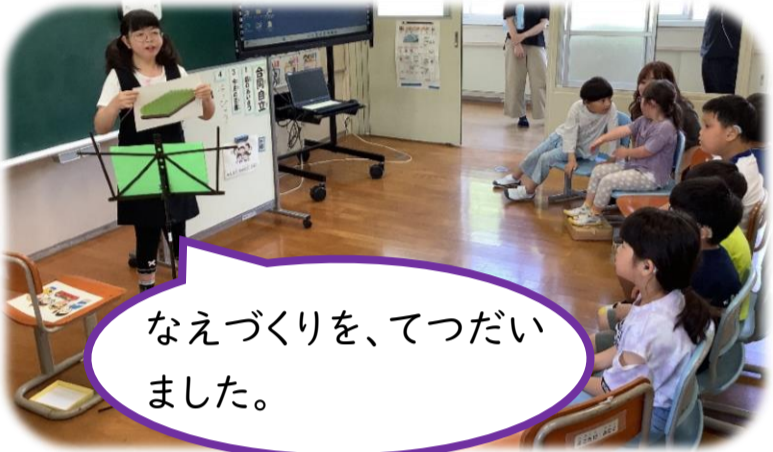
なえづくりを、てつだいました。