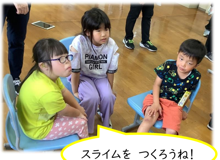
スライムをつくろうね!