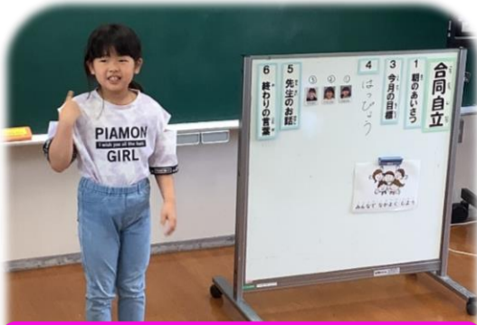
今月の目標を発表しました。