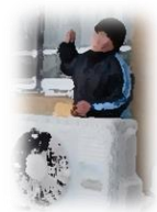
泣いてないもん (今年は・・・)