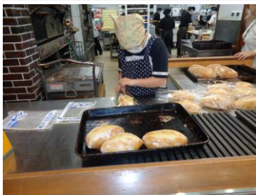
ボルガはたらいて笑おう