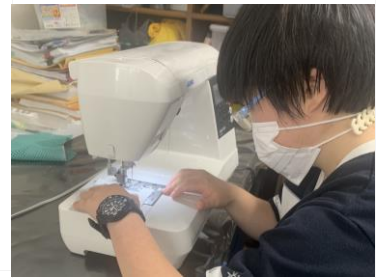
ワークサポートみらいず