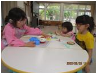
お皿・コップ並べ

幼児にとって最初の社会である家庭のことを題材にした「おうちごっこ」に取り組みました。料理、洗濯、掃除の各場面を設定し、絵カードや文字カードも手がかりにしながら遊びました。お母さん役の幼児は、エプロンを着けて、お皿やコップを並べたり、味見をしたり、洗濯物を干したり、掃除機をかけたりして楽しく遊びました。「おうちごっこ」遊びの終了後、各家庭でのお手伝いにつながっています。