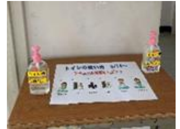
トイレ入口の消毒用アルコール