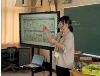
フェイスシールド装着

ろう学校の生徒は、教師の口形を見ることで、聞こえにくさを補っています。そのために、フェイスシールドや透明マスクを装着して授業を行っています。また、給食時には、間隔をあけて同じ方向を見ながら、会話も控えて食事をしています。他にも放課後には職員がドアの取手や机、椅子など、生徒の手に触れるところを毎日消毒するなど、感染防止対策に取り組んでいます。