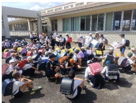
集団下校で下級生をお世話する6年生

校門のつつじも、赤や白など、色鮮やかな花を咲かせ、子どもたちの登校を見守っています。季節も少しずつ、春から初夏へと移り変わりつつあります。